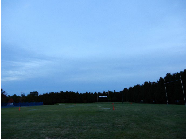
図2 会場写真1 (全体)