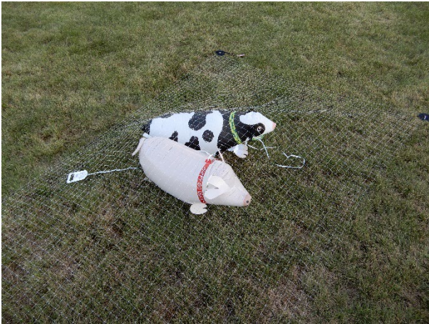
図4 バルーン写真1 (豚はダミー)