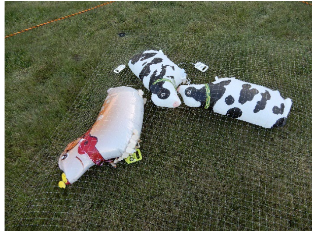
図5 バルーン写真2 (鹿はダミー)