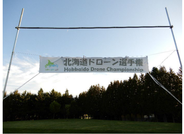
図3 会場写真2 (一文字)